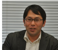
次回コンクールをより良いものとするために、グループ形式で教員・学生ともに意見を出し合いました。