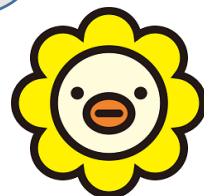
オリコ公認キャラクター 「オリコトリ」